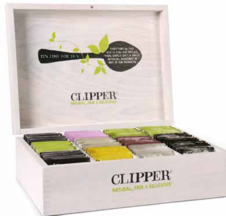
Hotel Box #2

Contattaci per gli assortimenti e le opzioni di questi display!