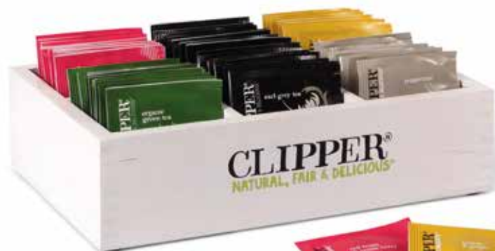
Hotel Box #1