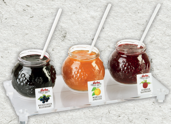
Espositore linea trasparente per 3 Confetture Naturein 640g 694225