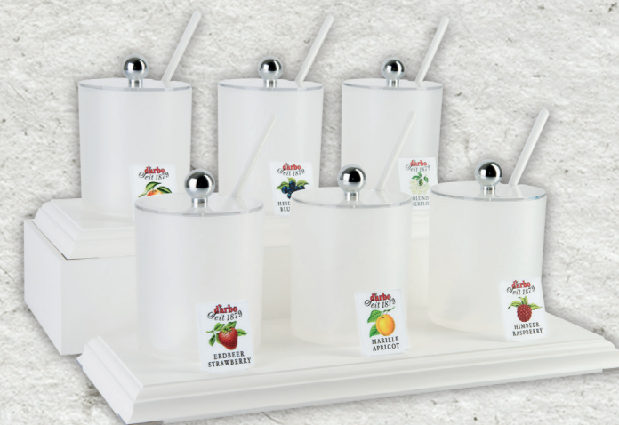
Espositore linea bianca per 6 coppette in acrilico 0,6l (variante su più gradini) 2x 694221 + 694222*