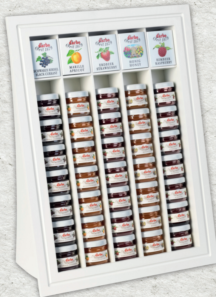
Espositore linea bianca per 35 minivasetti 28g