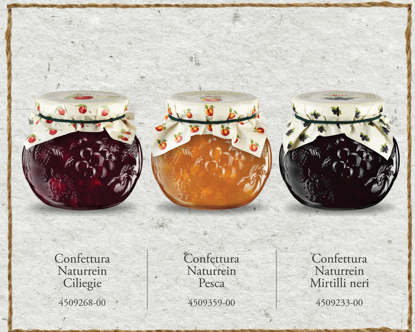
Confettura Nurrein Ciliegie

Nei migliori hotel si serve solo il meglio, anche a colazione: le confetture Nurrein di Darbo nei vasetti decorativi. Le confetture Nurrein di Darbo vengono prodotte secondo un'antica ricetta di famiglia. Oggi come allora, utilizziamo solo frutta di alta qualità, riscaldandola e rimessandola con cura. Così si conserva l'aroma naturale della frutta. Inoltre l'alto contenuto di frutta fino al 55% assicura un'esperienza dal gusto indimenticabile. Oltre al piacere culinario, anche l'occhio vuole la sua parte. Il vasetto di vetro, dalla forma particolarmente invitante che richiama alla frutta, si abbina perfettamente alle vostre colazioni a buffet. Per le nostre confetture naturali utilizziamo solo frutta, zucchero, succo di limone concentrato e gelificante pectina.