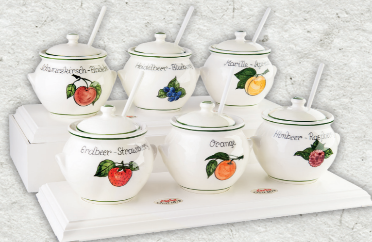
Espositore linea bianca per 6 coppette in ceramica 0,5l (variante su più gradini)