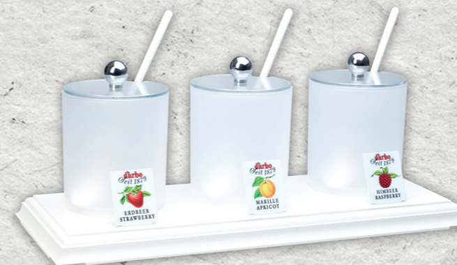
Espositore linea bianca per 3 coppette in acrilico 0,6l 694221