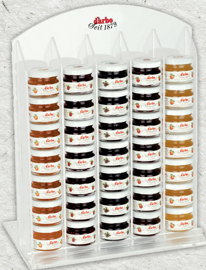
Espositore linea trasparente per 35 minivasetti 28g