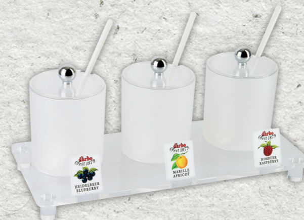
Espositore linea trasparente per 3 coppette in acrilico 0,6l 694225