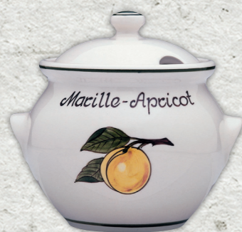
Coppetta in ceramica 0,5l

694152 (coppetta albicocche + coperchio)