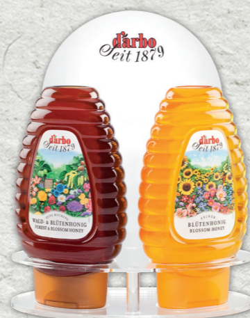
Espositore linea trasparente per 2 dosatori di miele 500g