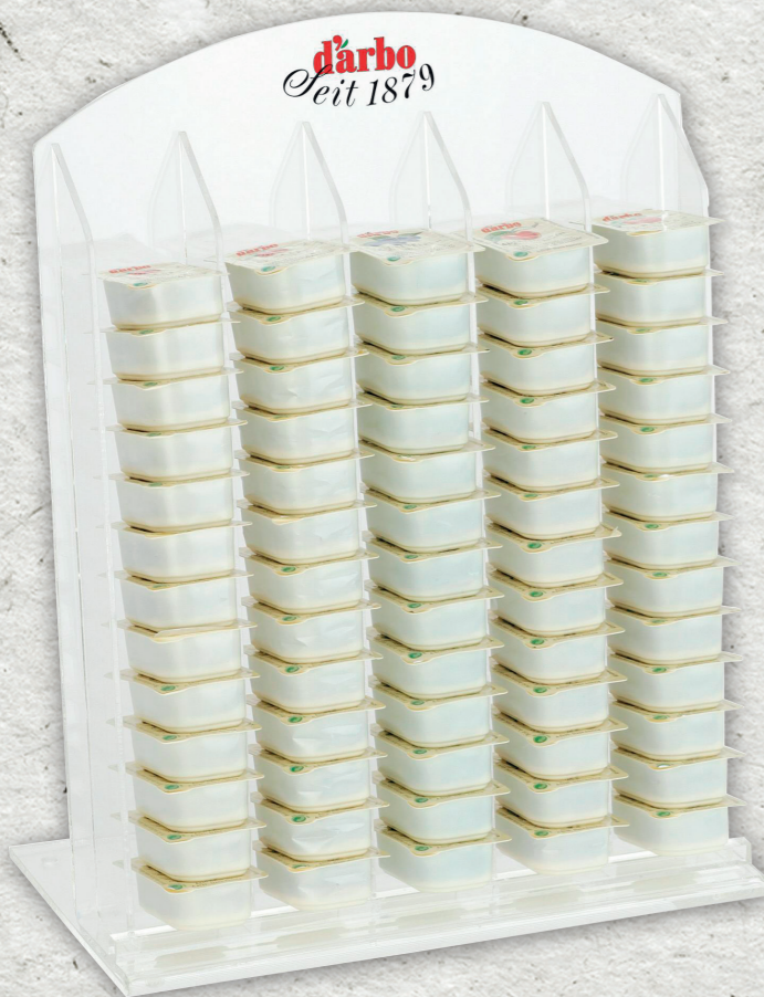
Espositore linea trasparente per 65 monoporzioni 25g, 14g