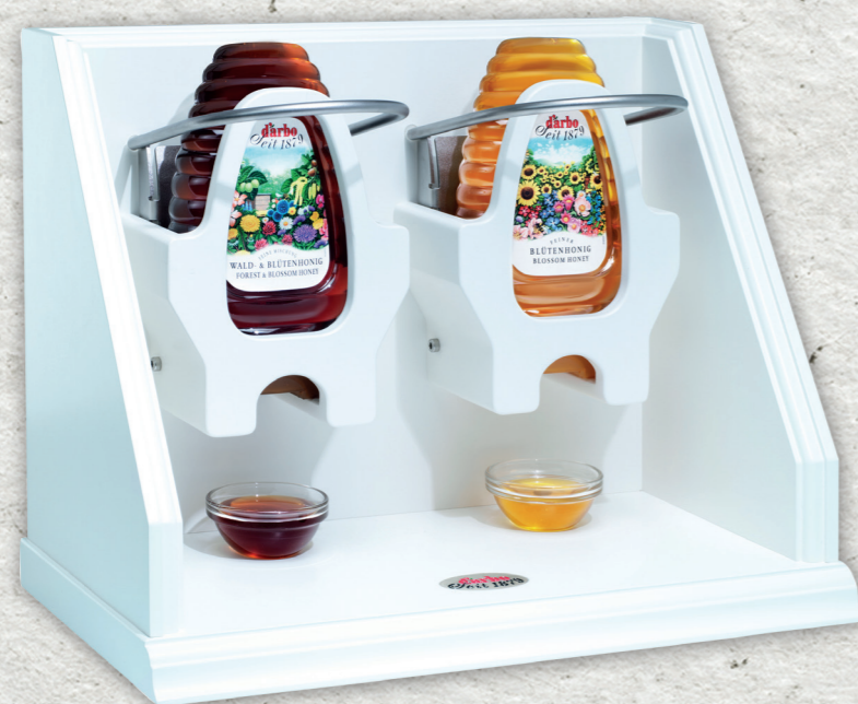
Espositore in legno e metallo per 2 dosatori di miele 500g