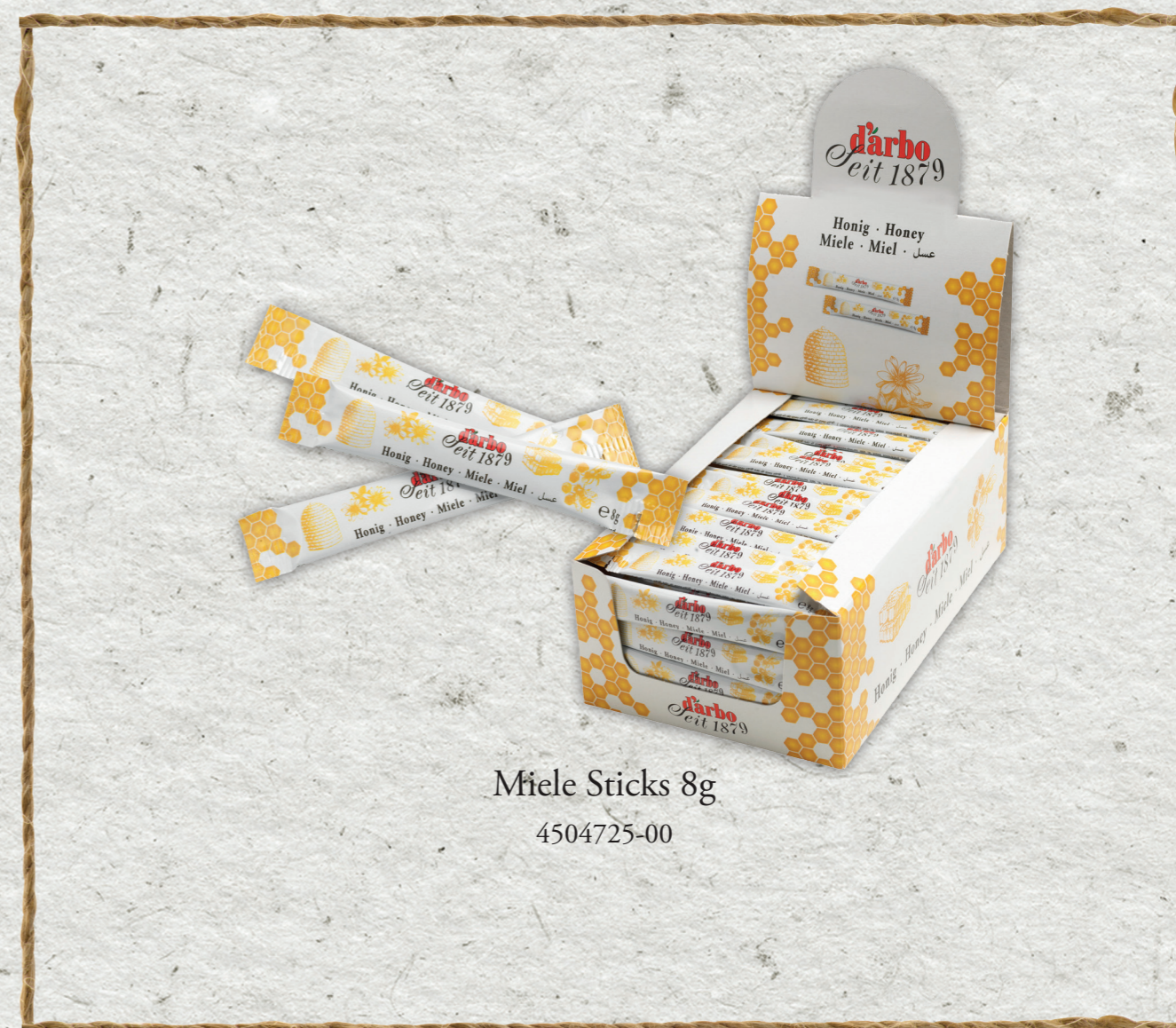
Miele Sticks 8g

Per il settore della ristorazione sono a disposizione le pratiche bustine di miele da 8g in confezioni da 80 pezzi. Il chiaro e delicato miele millefiori è ideale per addolcire tè o altre bevande, per dare il tocco finale a müsli o yogurt o per preparare i classici panini al miele. Grazie alla pratica bustina, questo prodotto è perfetto non solo per le colazioni a buffet, ma anche per il servizio in camera, i negozi da asporto, per le linee aeree e in generale quando bisogna risparmiare spazio. La presentazione multilingue, preparata con attenzione, delle nuove bustine di miele risulterà di interesse anche per gli ospiti internazionali.