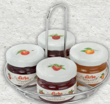
Espositore in metallo per 4 minivasetti 28g