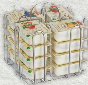
Espositore in metallo per 16 monoporzioni 25g, 14g