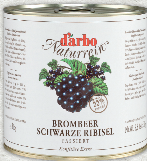
Confettura Nurrein More e Ribes neri 4503898-00

Disponibili in barattoli da 3kg nei gusti Albicocche, Fragole, Lamponi, Frutti di bosco, Mirtilli neri, More e Ribes neri, Ciliegie e Arance.