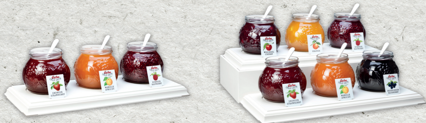
Espositore linea bianca per 3 Confetture Naturein 640g 694221