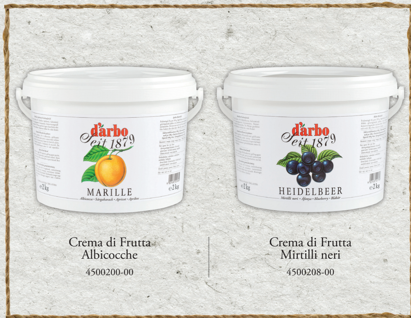
Crema di Frutta Albicocche 4500200-00

Se non ne avete mai abbastanza delle nostre creme di frutta, ricorrete ai nostri contenitori più grandi. Le creme di frutta, sia quelle passate, di consistenza fine, sia quelle con i pezzi di frutta, non sono solo un elemento fondamentale per le colazioni a buffet. Anche i vostri cuochi e pasticceri saranno estasiati nel vedere come queste creme riescono a fare magie con i loro deliziosi dessert e dolci e a dare il tocco finale a torte e pasticcini. Con le creme di frutta di Darbo sarà una delizia per i vostri ospiti, garantita da mattina a sera.