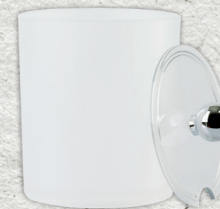
Coppetta in acrilico 0,6l 694215 (coppetta) + 694316 (coperchio)