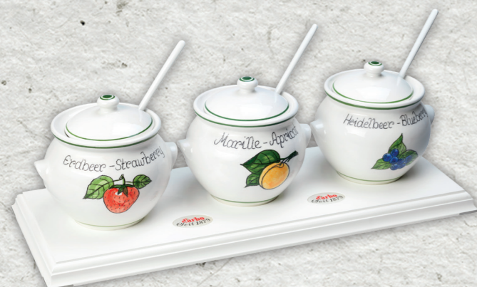
Espositore linea bianca per 3 coppette in ceramica 0,5l