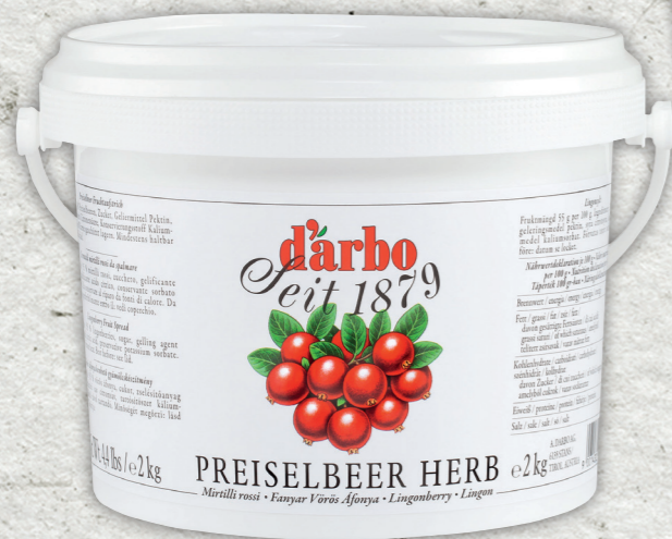
Composta Mirtilli rossi 4500211-00

Capriolo, cervo o cotoletta alla viennese sono alcune delle specialità tipiche della cucina austriaca. E cosa non può certo mancare? I mirtilli rossi di Darbo, ovviamente! I migliori mirtilli rossi del mondo crescono selvatici in Scandinavia. Per la nostra composta utilizziamo solo frutti selezionati, originari di questa regione. Così il sapore leggermente aspro dei nostri mirtilli rossi, conferisce una nota speciale non solo ai piatti di carne, ma anche a svariati dolci.