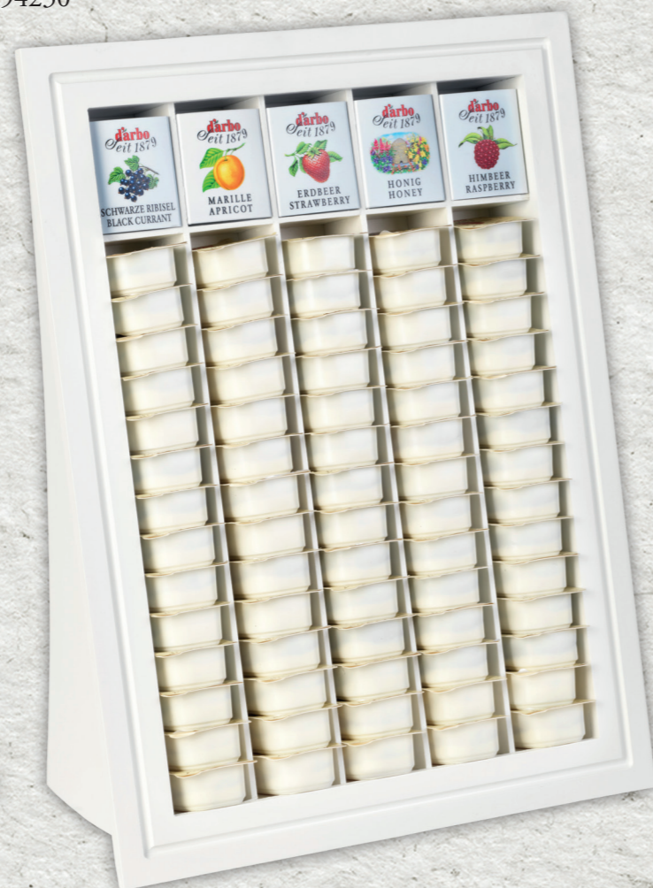
Espositore linea bianca per 70 monoporzioni 25g, 14g