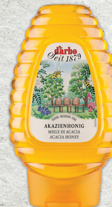
Miele di Acacia