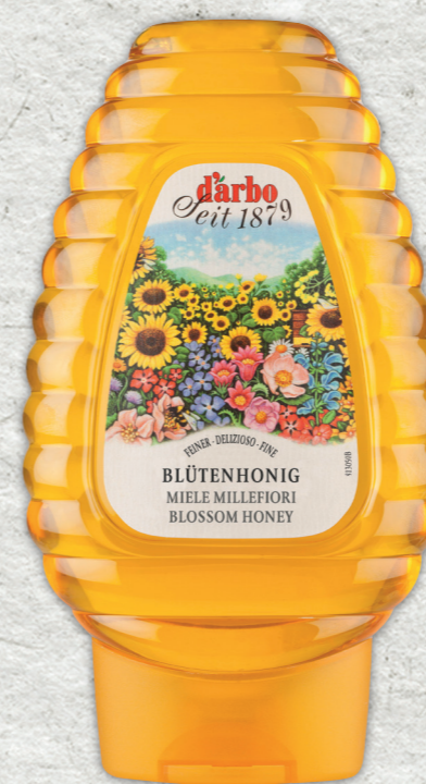
Miele di Millefiori

Con i simpatici dosatori di miele di casa Darbo da 500g a forma di alveare, la colazione diventa un momento da leccarsi i baffi. I pratici dosatori garantiscono un dosaggio facile e pulito, la soluzione ideale per le colazioni a buffet. Grazie agli espositori in legno e in materiale acrilico è possibile disporre il miele sul tavolo da buffet in modo decorativo. In casa Darbo, potete contare su decenni di esperienza nella selezione, acquisto e confezionamento del miele.