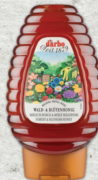
Miele di Millefiori e di Bosco