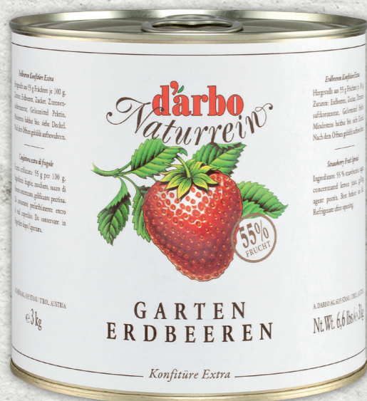
Confettura Nurrein Fragole 4500350-00

Coccolate i vostri ospiti con le confetture Nurrein di Darbo nel barattolo da 3 kg. Le confetture Nurrein di Darbo vengono prodotte secondo un'antica ricetta di famiglia. Oggi come allora, utilizziamo solo frutta di alta qualità, riscaldandola e rimestandola con cura. Così si conserva l'aroma naturale della frutta. Inoltre l'alto contenuto di frutta fino al 55% assicura un'esperienza dal gusto indimenticabile. Per le nostre confetture naturali utilizziamo solo frutta, zucchero, succo di limone concentrato e gelificante pectina.