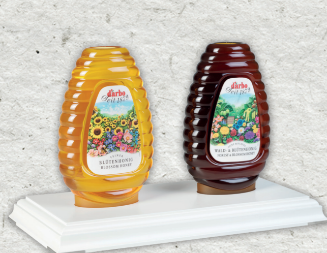
Espositore linea bianca per 2 dosatori di miele 500g