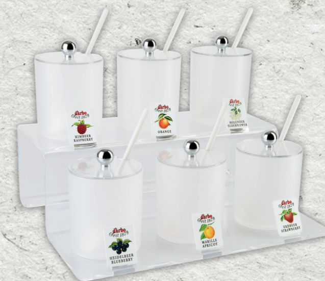
Espositore linea trasparente per 6 coppette in acrilico 0,6l 694226