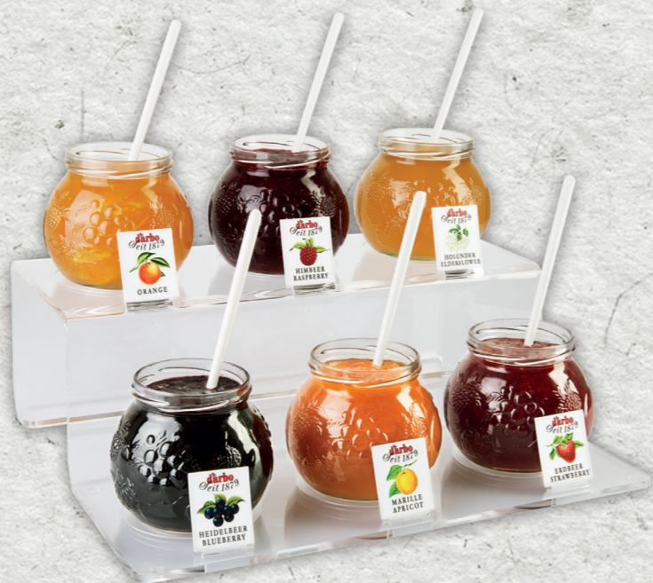
Espositore linea trasparente per 6 Confetture Naturein 640g 694226